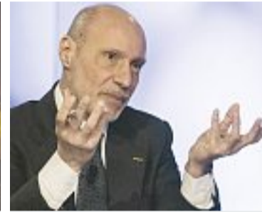
Gregorio De Falco Il senatore, 53 anni, chiede radicali modifiche al «decreto sicurezza»