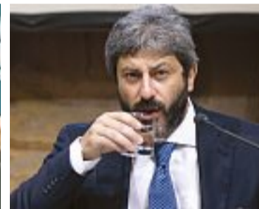
Roberto Fico Il presidente della Camera, 44 anni, critico con gli alleati della Lega