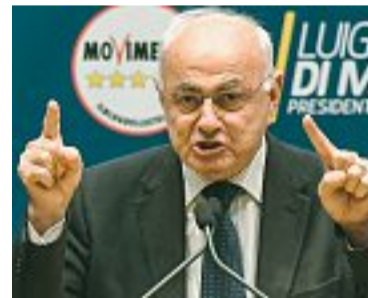
Elio Lannutti Il senatore, 70 anni, sostiene che il dl fisco è contrario ai valori del M5S