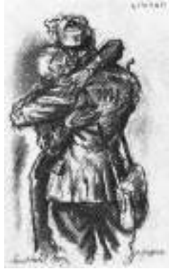
Rientro a casa