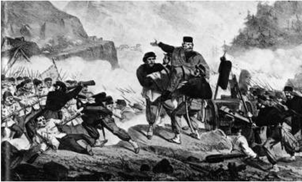
Garibaldi guida i suoi uomini a Bezzecca