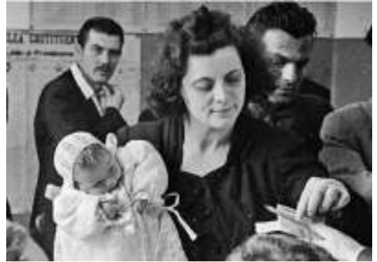
Le donne votano