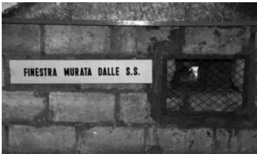
Interno del Museo storico della Liberazione di Roma (Via Tasso)