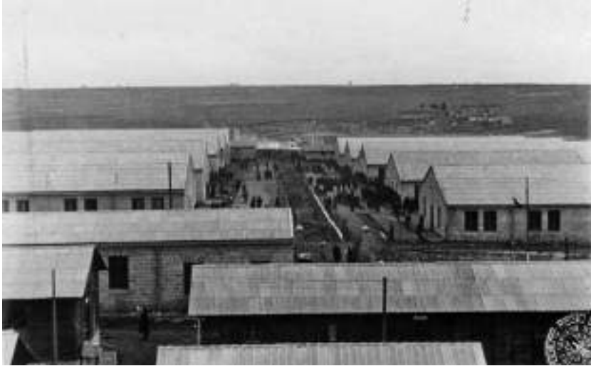
Campo 65, 1942.

Comune di Altamura, la cui ultima giunta ha finalmente stanziato a bilancio i primi fondi per la messa in sicurezza di due edifici, quelli più rappresentativi, prima che crollino definitivamente.