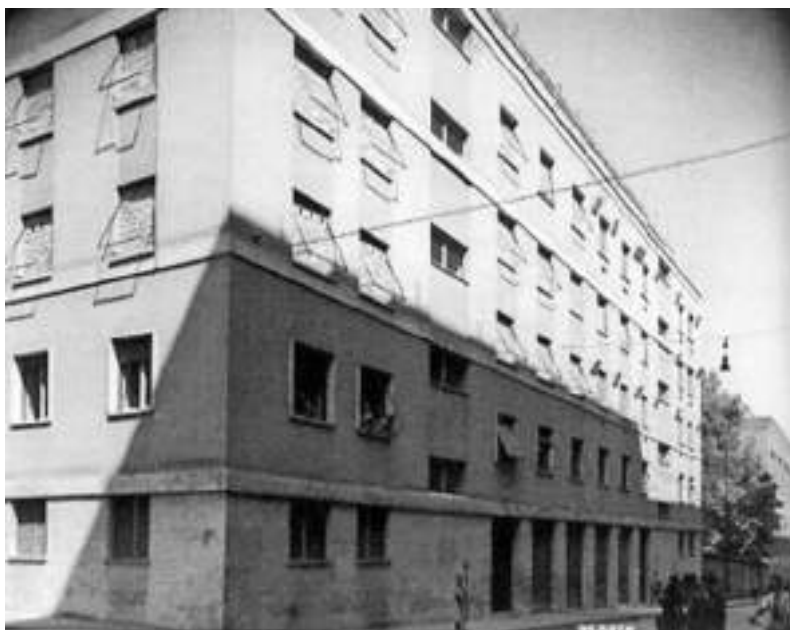
Museo storico della Liberazione di Roma (Via Tasso)

nella pagina iniziale è disegnato l'ingresso del carcere rappresentato come un castello delle fate e nella parte bassa si legge: “Per me si va nella Zuchthaus (penitenziario) dolente/Per me si va nell'eterno dolore / Per me si va