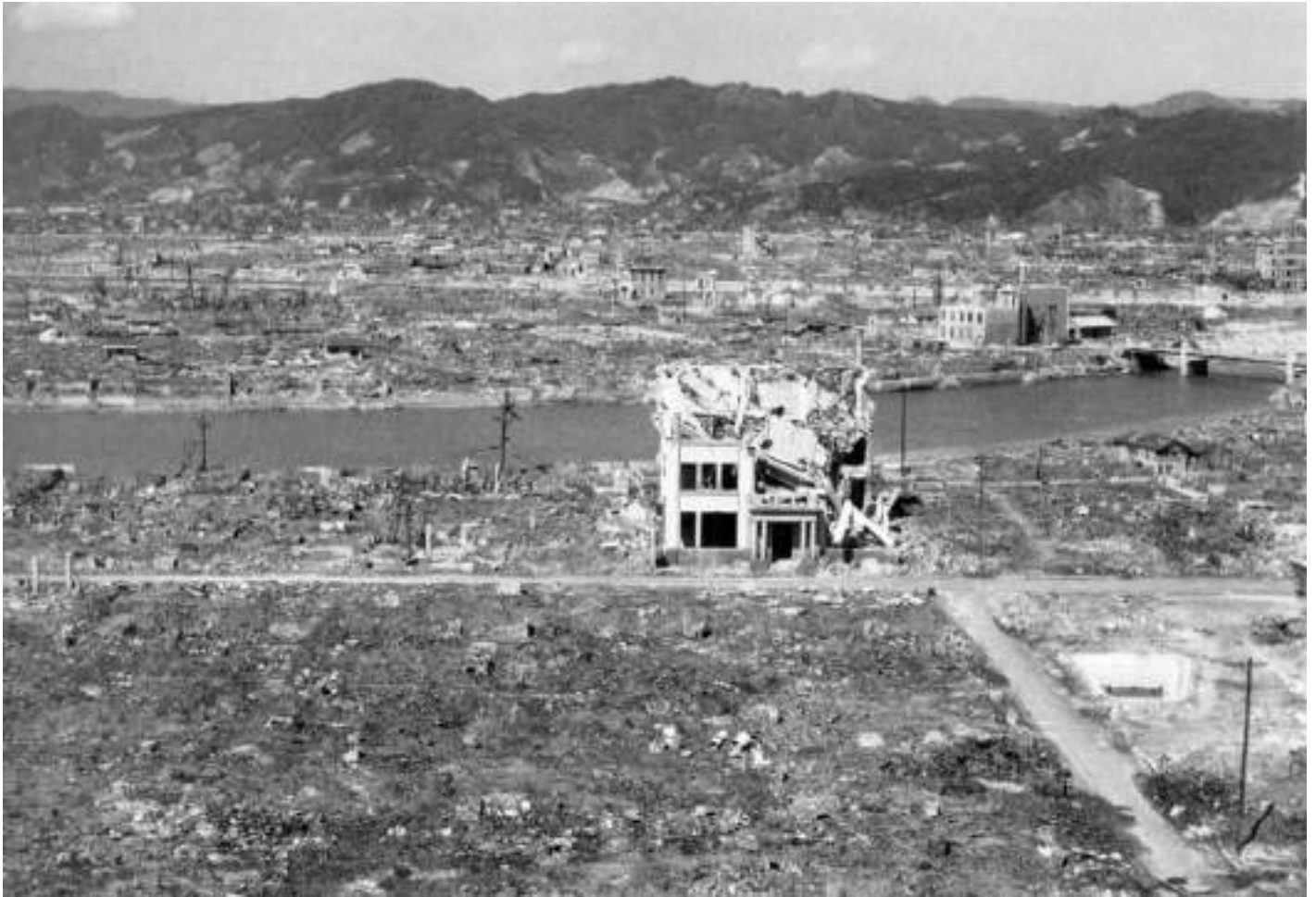
Hiroshima, agosto 1945, Città evaporata, immagine scattata dall'aviazione americana. In un attimo non c'è più niente, la collina rivestita di verde è ora una roccia rossastra e tutto è sparito, la terra è nuda.