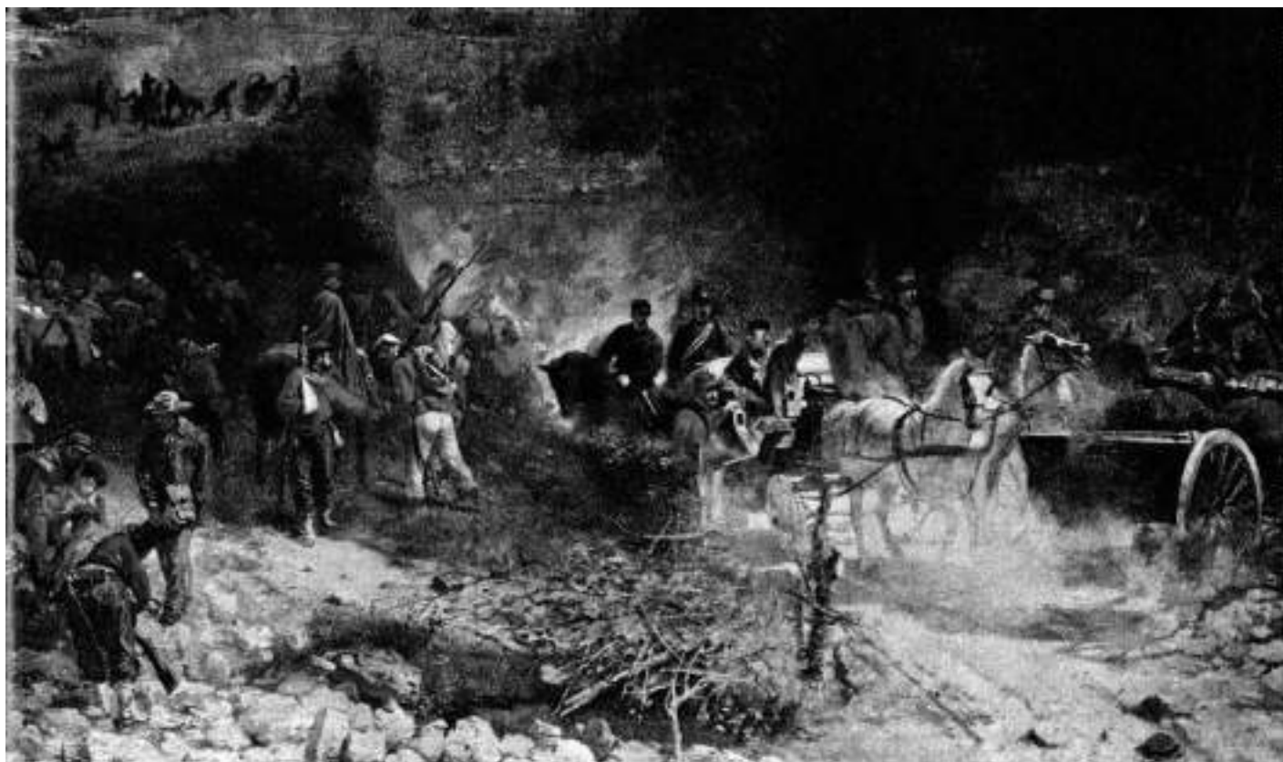
La battaglia di Bezzecca (dipinto di F. Zonaro, Museo del Risorgimento di Milano)

Quest'anno ricorre il 160° anniversario della Terza guerra d'Indipendenza. Benché ormai trascurata anche nei manuali scolastici, essa rappresentò la prima grande prova, sulla scena europea, dell'Esercito dell'Italia unita. Ci soffermiamo qui sulla battaglia di Bezzecca.