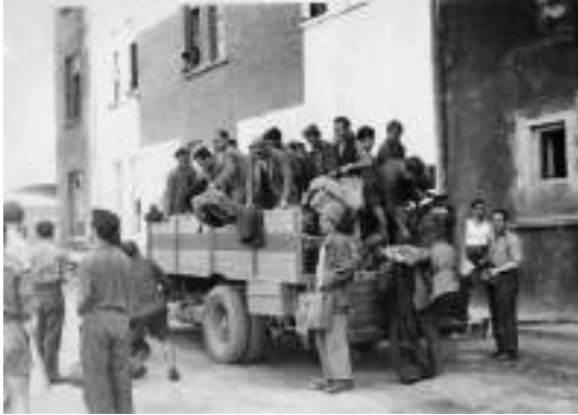
Rientro in Italia degli internati