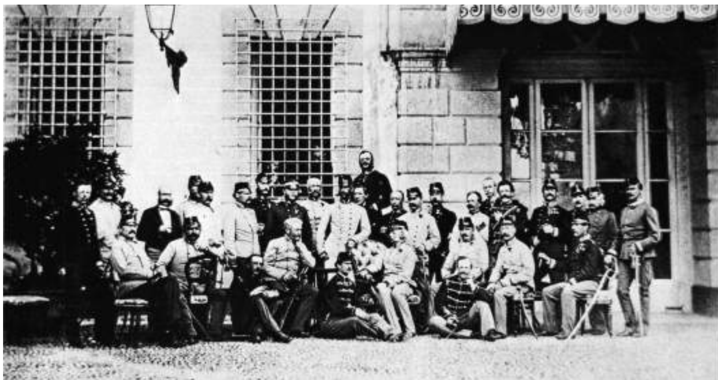
L'Arciduca Alberto con il suo stato maggiore

Inizialmente dislocato nella zona Desenzano-Brescia-Salò, il corpo “garibaldino” fu impiegato per la presa del ponte di Caffaro e di Monte Suello, dovendo però lasciare quest'ultimo quando fu richiamato verso Brescia per tamponare gli effetti della rotta di Custoza. Soltanto il 3 luglio Garibaldi riuscì a riprendere l'offensiva, dando l'assalto a Monte Suello e a Vezza, ormai occupati e ben difesi dagli austriaci. A Monte Suello – che fu la battaglia più rilevante, nonostante il mancato successo della manovra di aggiramento del nemico attraverso Rocca d'Anfo, da parte di un contingente di 500 uomini al comando del maggiore Mosto – il gene-