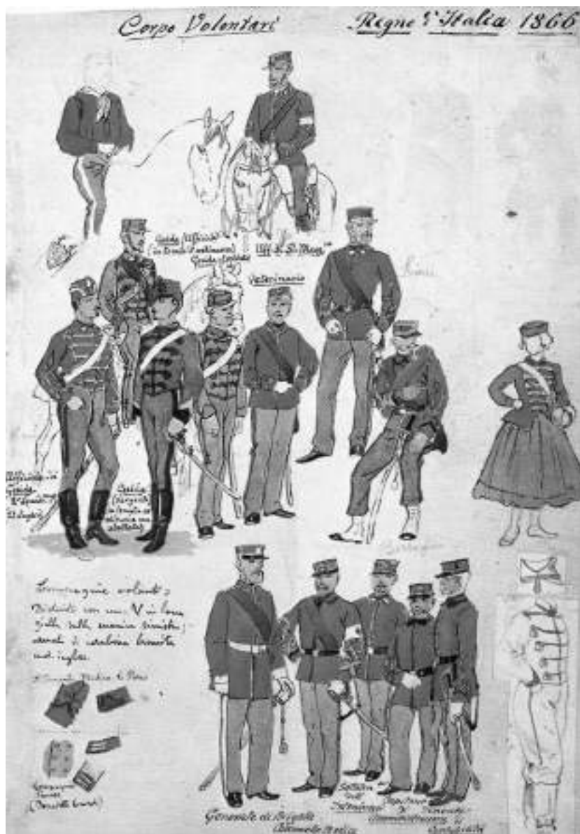
Uniformi del Corpo Volontari in una tavola di Quinto Cenni.